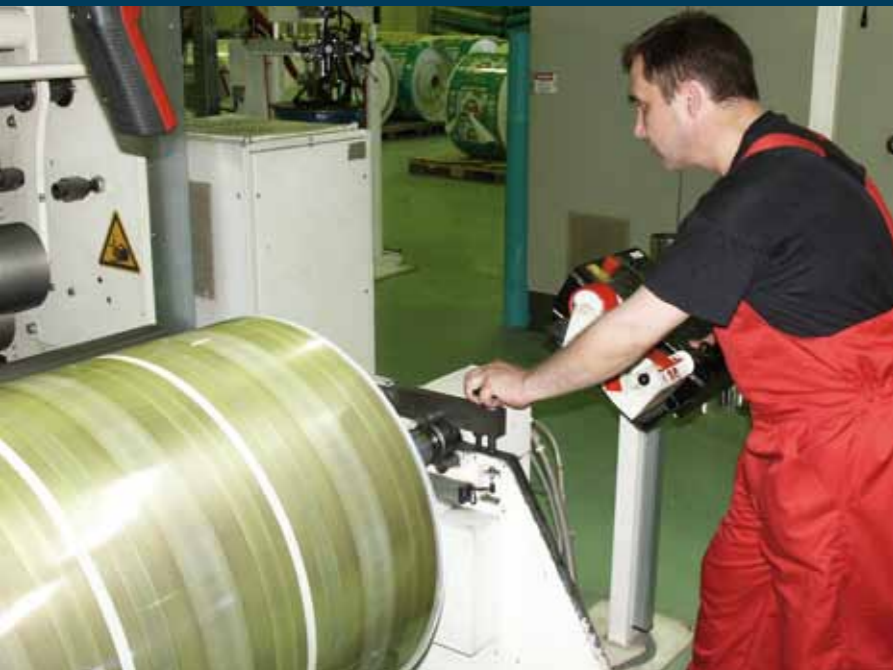
▲ NORDENIA SLAVNIKA производит высококачественные гибкие упаковочные материалы на самом современном оборудовании.